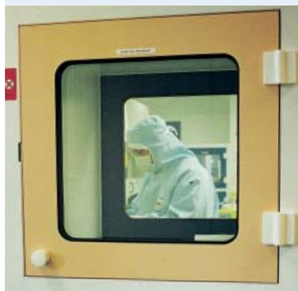
CONFORME À LA NORME DE BASE SUR LES GMP / BPF

Couleurs standards : Blanc (RAL 9010), Bleu roy (RAL 5005), Sable